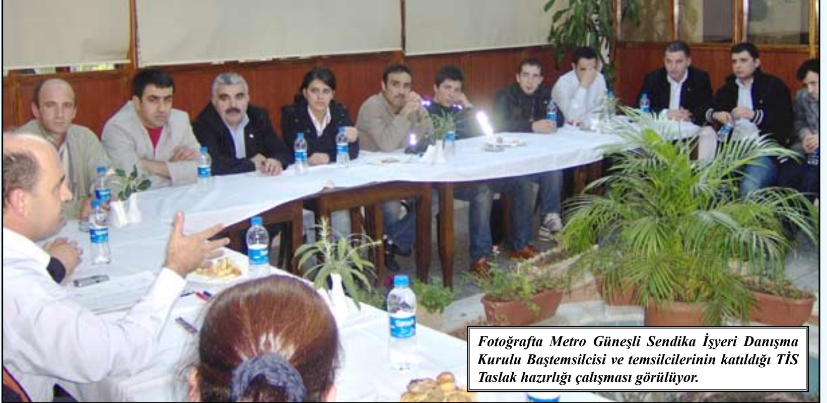
Fotoğrafta Metro Güneşli Sendika İşyeri Danışma Kurulu Baştemsilcisi ve temsilcilerinin katıldığı TİS Taslak hazırlığı çalışması görülüyor.

Metro Grosmarketlerde bağtlanacak 3. dönem Toplu İş Sözleşmesi nedeniyle Çalışma ve Sosyal Güvenlik Bakanlığı'na 8 Eylül'de başvuru yapıldı.