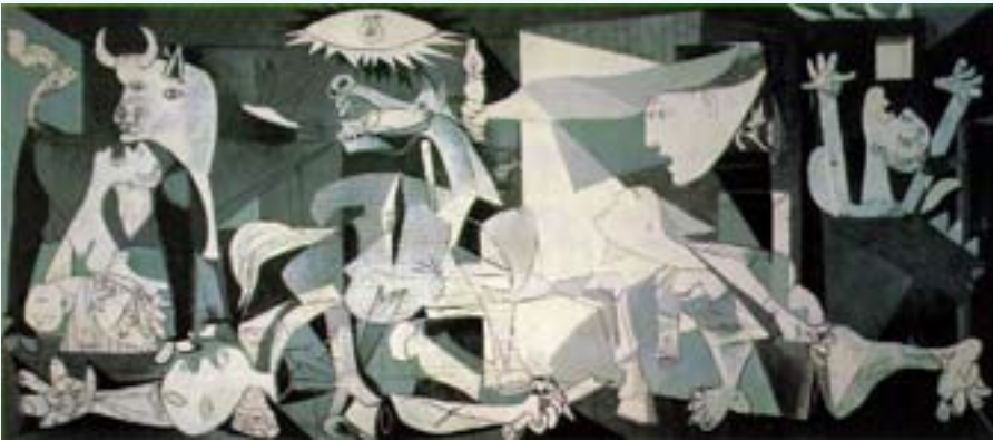
Picasso'nun Guernica bombardımanını resmettiği, Guernica adlı tablosu