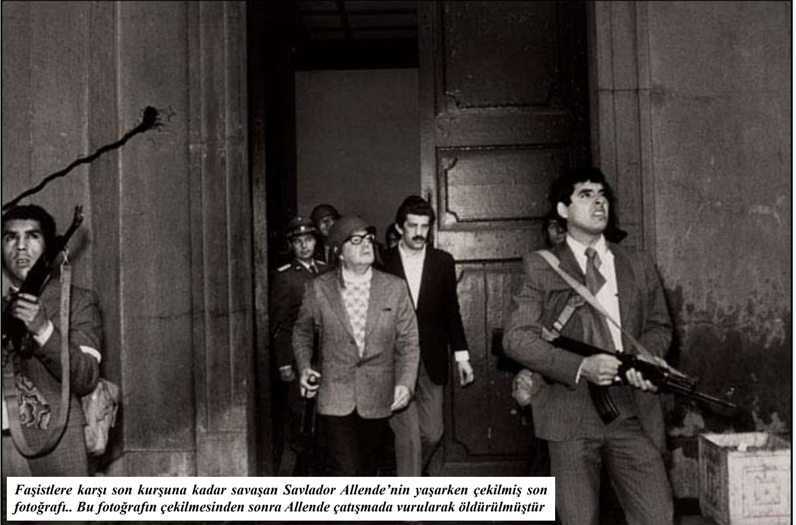
Faşistlere karşı son kurşuna kadar savaşan Sallador Allende'nin yaşarken çekilmiş son fotoğrafı.. Bu fotoğrafın çekilmesinden sonra Allende çatışmada vurularak öldürülmüştür

Aynı askeri faşist darbe ile Şilili devrimci ozan Pablo Neruda'da katledilmişti.