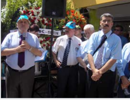
DİSK Başkanı Süleyman Çelebi

Genel Sekreterimizden sonra söz alan DİSK Genel Başkanı Çelebi ; "Özcan abi diyoruz, bizim abimizdi. Özcan abi, sınıf sendikacılığının öncülüğünü yapan, sınıf sendikacılığının politik mücadelesini de veren, doğru önderlik yapan, yalpa yapmayan, diz çökmeyen onurlu bir mücadelecidi. Doğru önderlik yaptı. Onun hiçbir zaman dik duruşundan ödün vermediğini hepimiz biliriz. Bütün içtenliğimle söylüyorum, başucu kitabımız gibiydi. DİSK Başkanı seçildiğimden sonra önemli konularda her zaman kendisine danıştım ve bize yol gösterir, birikimlerini bizimle paylaşır, bunu bir içtenlikle, sorumlulukla yaparak bize katkı sunardı. Hepimizin başı sağ olsun." diye konuştu.