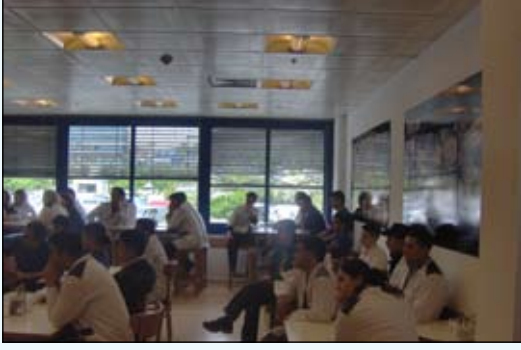
Metro Güneşli'deki toplantıdan görüntüler