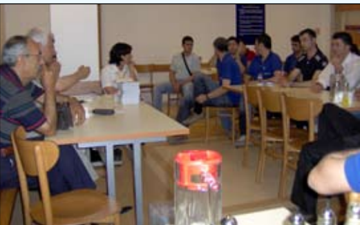
Metro Gaziantep toplantısı