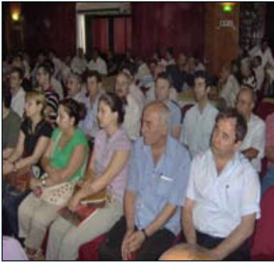
Temsilcilerimiz DİSK'in düzenlediği panelde