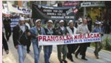
Lastik işkolu TİS görüşmelerindeki uyuşmazlık sürecinde işçiler eylem yaparken

Konfederasyonumuza bağlı LASTİK-İŞ Sendikasının örgütlü olduğu PIRELLİ, GOODYEAR ve BRİSA işyerlerinde çalışan yaklaşık 4000 işçiyi kapsayan toplu iş sözleşmesi görüşmeleri 22 Mayıs’ta anlaşma ile sonuçlandı.