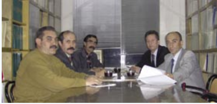
JMO Yöneticileri ile Ankara Şubemiz yöneticileri TİS görüşmelerinde birarada görülüyor

TİS'e göre üç aylık ücret tutarında ikramiye verilecek. İşyerinde diğer tazminat ve sosyal ödemelerin net tutarları ise şöyle; Kıdem Zammı (her yıl için aylık): 5,50 YTL, Kasa Tazminatı (aylık): 58,00 YTL/Net, Sorumluluk Tazminatı (aylık): Maaşın %10'u, Yıpranma Tazminatı (aylık): 93,00 YTL/Net, Çocuk Yardımı (aylık): 21,00 YTL/Net, Evlenme Yardımı: 5 günlük ücret tutarı, Doğum Yardımı: 250,00 YTL/Net, Ölüm Yardımı: 8.250 YTL/Net, Yemek Yardımı (aylık): 93 YTL/Net, Ulaşım Yardımı (aylık): 50 adet bilet tutarı, Yakacak Yardımı (aylık): 50,00 YTL/Net, Öğrenim Yardımı: 35,00 – 45,00 – 73,00 YTL/Net, İzin Yardımı: 30,00 YTL/Net, Bayram Yardımı: 22,00 YTL/Net, Giyim Yardımı: 68,00 YTL/Net, Kira Yardımı (aylık): 20,00 YTL/Net, Eğitim Yardımı: 73,00 YTL/Net, Yıllık Ücretli İzin: 30 işgünü, Haftalık Çalışma Süresi: 40 saat, 1 Mayıs işçi sınıfının birlik, mücadele, dayanışma günüdür. 1 Mayıs günü işe gelmeyen işçi, ücretli izinli sayılır.