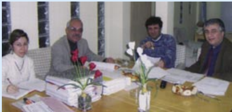
İzmir Tabip Odası yöneticileri ile sendikamız İzmir Şube Başkanı ve işyeri temsilcisi birarada

Kıdem Zammı (her yıl için aylık) : 10,00 YTL, Kasa Tazminatı (aylık) : Ücretin %10 net tutarı, Aile ve Çocuk Yardımı : 657 sayılı yasa uyarınca, Evlenme Yardımı : 20 günlük net ücret tutarı, Doğum Yardımı : 10 günlük net ücret tutarı, Ölüm Yardımı : 12.500,00 YTL – 500,00 YTL, Yemek Yardımı : Her gün için 8,00 YTL/net, Ulaşım Yardımı : Aylık zaruri yol ücreti tutarı, Öğrenim Yardımı : İlköğretim 250,00 YTL/net – Lise 300,00 YTL/net – Yüksek öğrenim 350,00 YTL/net, Yakacak Yardımı (her ay) : 35,00 YTL/net, Yıpranma Tazminatı : İşyerinde 5 yıldan sonraki her hizmet yılı için 10,00 YTL/net.